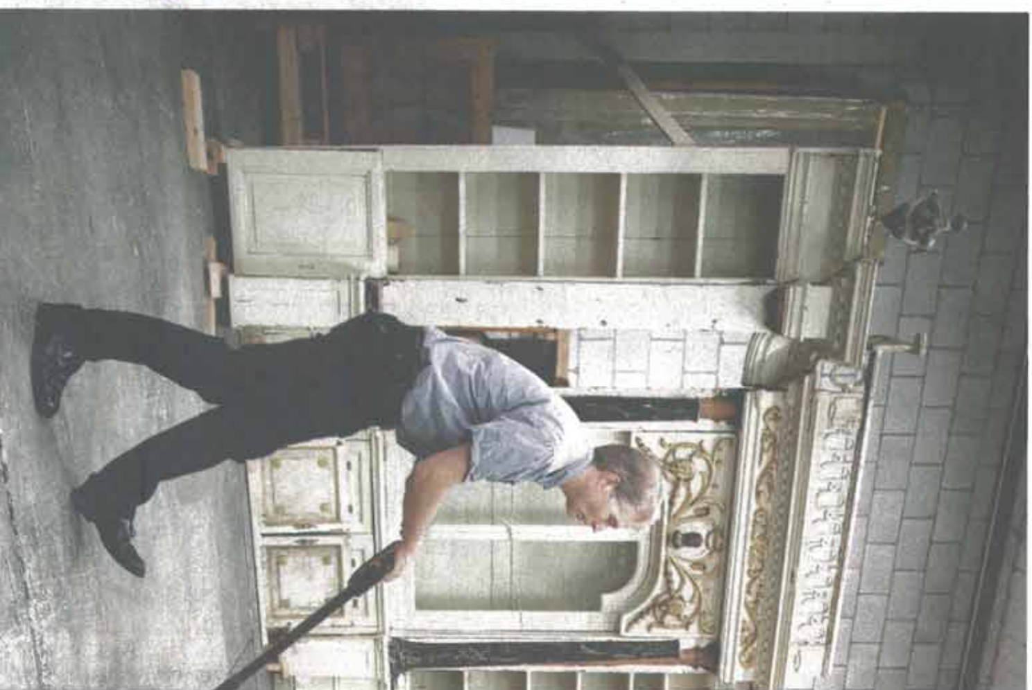
Het interieur dat lang deel heeft uitgemaakt van de apotheek in het Medisch Pharmaceutisch Museum,