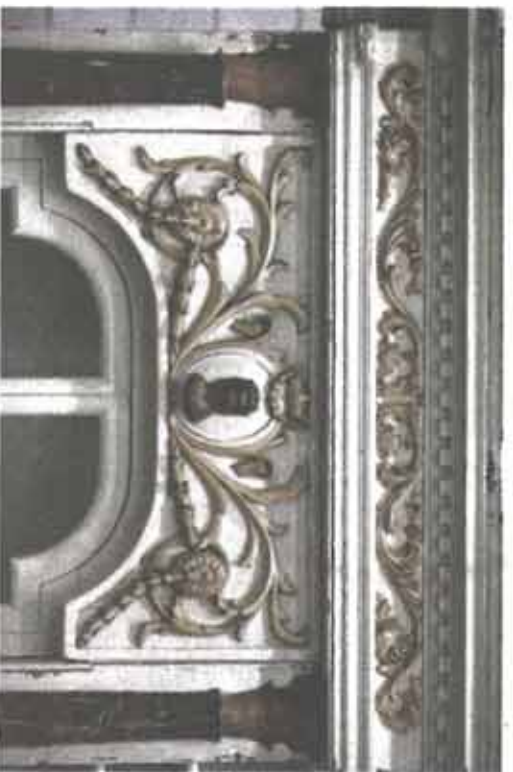
Eén van de ornamenten van het 18de-eeuwse banketbakkersinterieur.