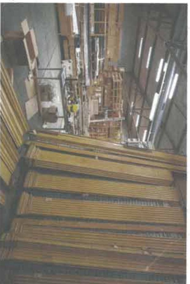
Een eigens-hijnselijk waardeloze verzameling planken, maar wel onderdeel van een stijlkamer.